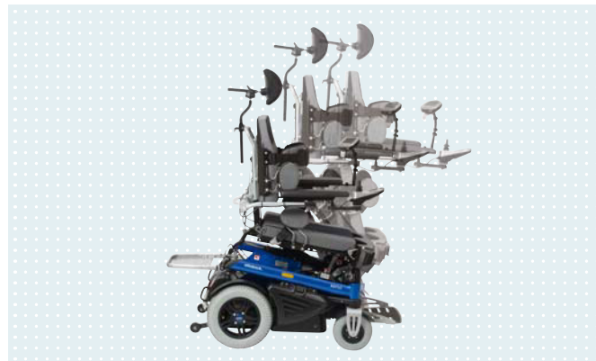
• Функция вертикализации