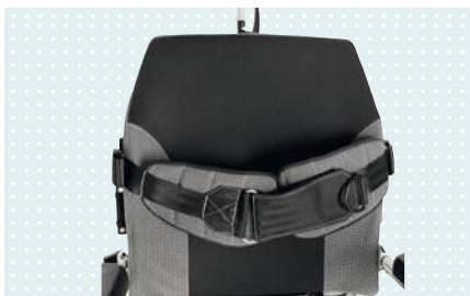
• Фиксатор грудного отдела