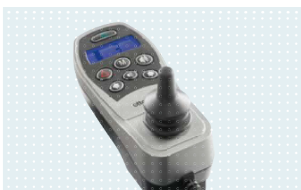
• Панель управления enAble50