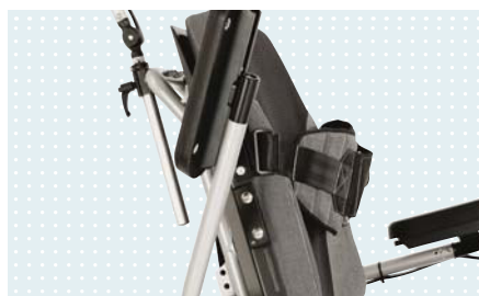
• Откидные подлокотники