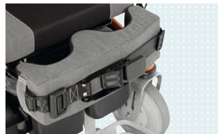
• Фиксатор коленей