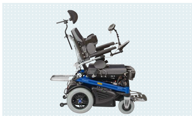
• Электронная регулировка угла наклона спинки 20° (опционально)