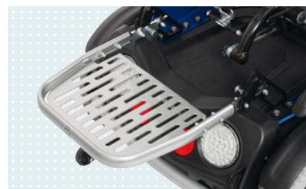
• Съемный багажник