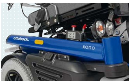
• Электрорегулировка угла наклона сиденья 15°