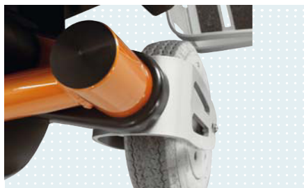
• Система независимого привода поворотных колес Servo