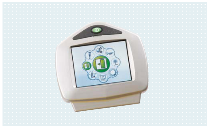
• Цветной дисплей