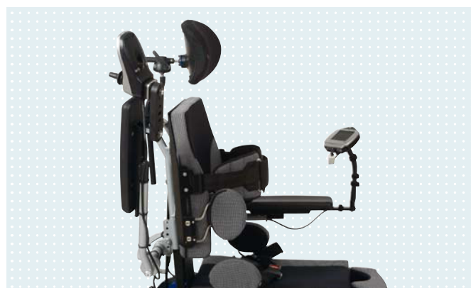
• Боковые поддержки для большей стабильности