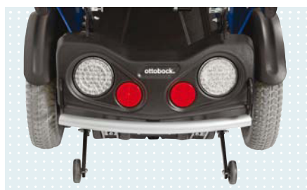
• Задние фары LED