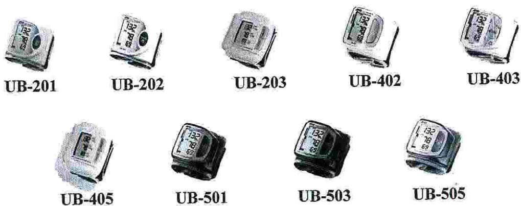
Рис.1 Фотография общего вида средства измерений

Прибор с помощью компрессионной манжеты закрепляется на запястье и после кратковременного нажатия кнопки START автоматически осуществляет: самотестирование, накачку манжеты с помощью встроенного компрессора до величины, установленной переключателем уровня, отображение на дисплее величины давления воздуха в манжете, последующий автоматический плавный выпуск воздуха из манжеты, процесс измерения систолического и диастолического значений артериального давления и частоты пульса, быстрый сброс воздуха из манжеты и высвечивание измеренных значений артериального давления и частоты пульса на дисплее.